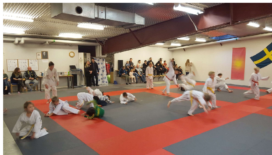
Deltagarna vid avslutningslägret och graderingen i juni