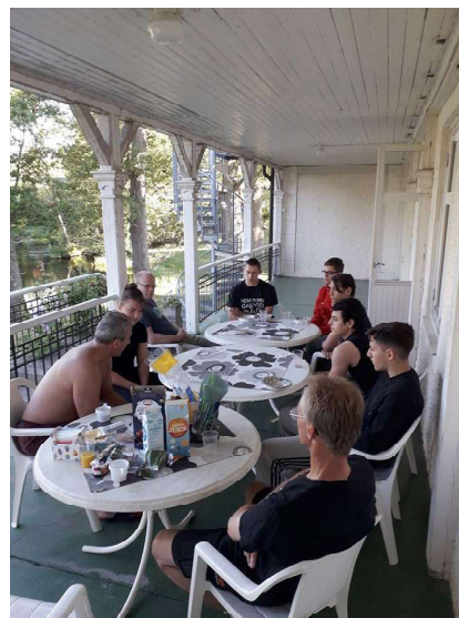
Frukost med peptalk på Kårfalla Herrgård inför SM i Lindesberg