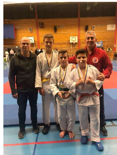
Medaljörer i Oxelöträffen 17 november