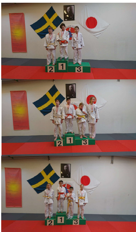
De olika pristagarna på SödertäljeCupen