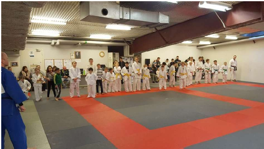
Från avslutningsgret i klubblokalen december 2018