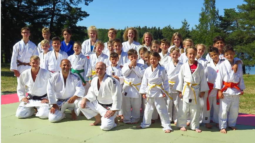
Från avslutningsgret i Brandalssund juni 2018

Året som gick -de viktigaste händelserna januari - december.