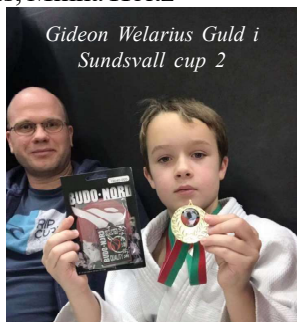
Gideon Welarius Guld i Sundsvall cup 2