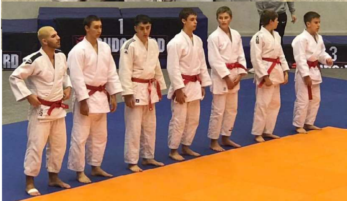
RM laget SÖJF på plats i Frövi den 27 oktober