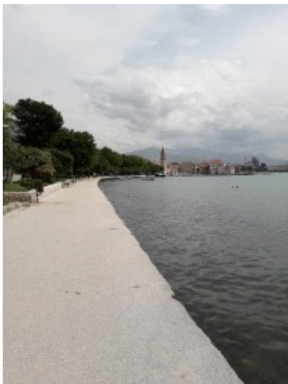
Strandprommenaden i Seget